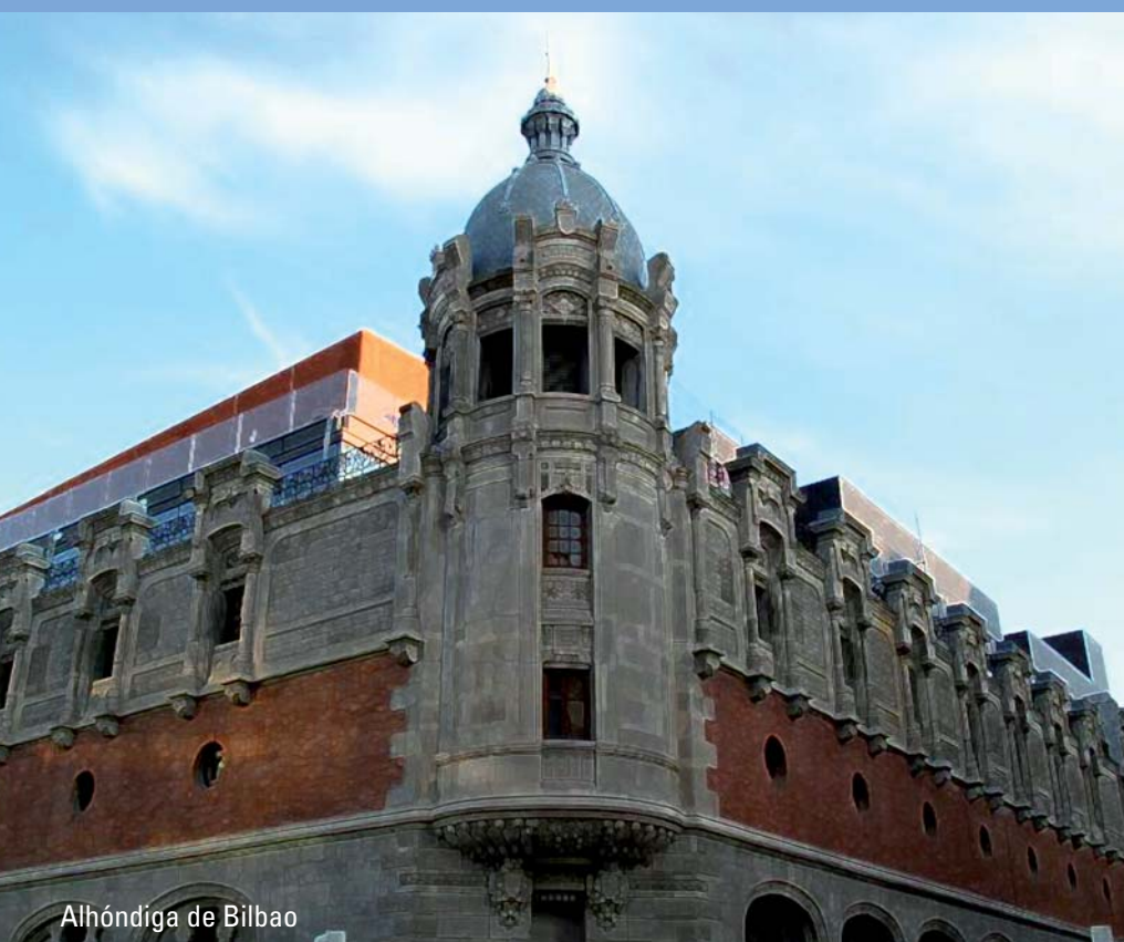
Alhóndiga de Bilbao

Auditorio de la Alhóndiga. Bilbao 5 y 6 de Noviembre de 2010